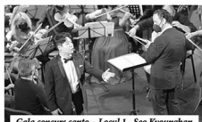
Gala concurs canto - Locul 1 - Seo Kyoungban

Primul din cele patru a avut loc, tradițional, în mai, luna în care Ionel Perlea s-a întors pentru ultima dată pe megalurile natale, în 1969.