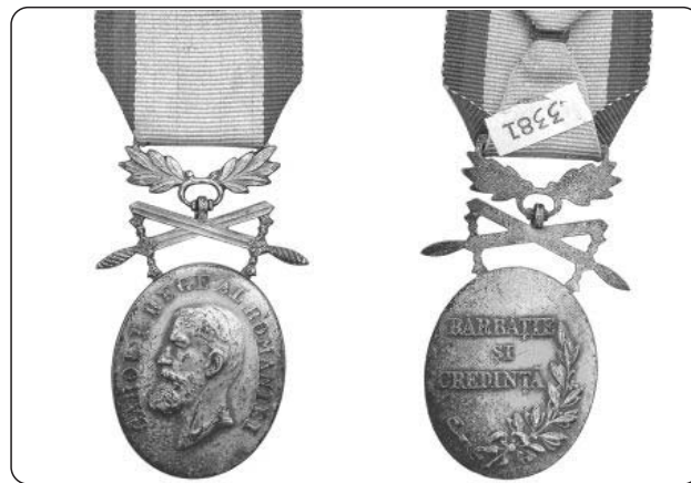
Fig. 1-2. Medalia „Bărbăție și Credință” cu spade, clasa a II-a.