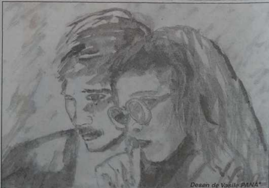
Desen de Vasile PANA*

Premiile se vor înmâna în cadrul Festivalului Armonii de primăvară din luna mai 2005.