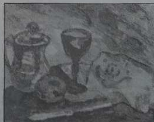
desen de Vasile PANĂ

Lucius afirmă în roman că a văzut pe zei. Creștinii nu se botează pentru că această Sfântă Taină le-ar prileji anumite teofanii sau vederi ale îngerilor și sfinților. Convertirea la cultul isiac și Botezul creștin aveau semnificația unui act prin care se intra într-o anumită comunitate: a celor inițiați și, respectiv, a Bisericii. Lipsit de dovezi extraordinare de „semne” cum cereau fariseii de la Mântuitorul și cum doreau păgânii, totuși Botezul mai avea (și are) caracter sacramental de Taină prin care se șterg păcatul strămoșesc și păcatele personale și se acordă harul Duhului Sfânt.