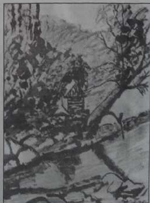
desene de Vasile PANĂ