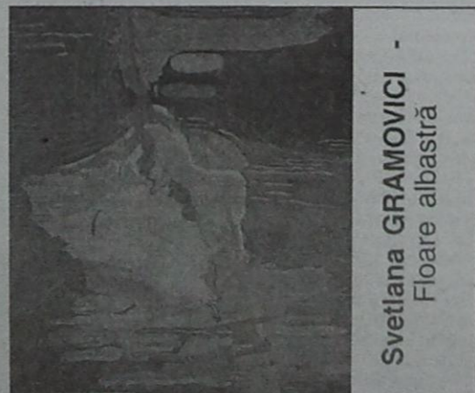
Svetlana GRAMOVICI Floare albastră