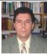
(urnare din numărul trecut)