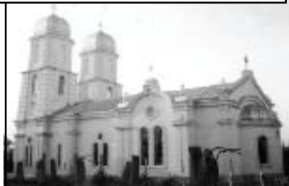
Biserica Sfântul Ierarh Nicolae din Bordușani

b. Pe insula lacului Bentul Mare, situat în aceeași balță, s-au descoperit mai multe fragmente ceramice din perioadele: neolitică (cultura Boian), geto-dacică (sec. IV-III î.Hr.) și medievală timpurie (cultura Dridu). Locuirii Boian îi asociem și un toporaș plat din gresie 5 .