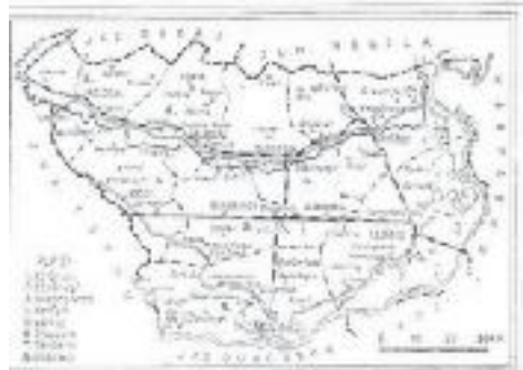
Județul Ialomița în anul 1938. După Enciclopedia României, II, ed. 1938.