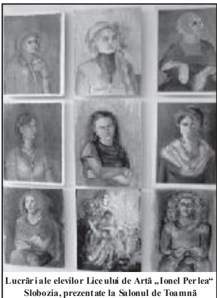
Lucrări ale elevilor Liceului de Artă „Ionel Perlea” Slobozia, prezentate la Salonul de Toamnă

În secolul al XIX-lea, odată cu răsândirea arendăriei, grijile proprietarilor pentru veniturile cărciumilor se vor diminua treptat. Localnicii sau străinii preiau administrarea birurilor, plătind proprietarilor de moșii taxe de arendare. Relația dintre arendași, proprietari, consumatori reprezintă, însă, un subiect ce urmează a fi cercetat, la fel cum ar merita studiat și evoluția cărciumilor Sloboziei până în zilele noastre.