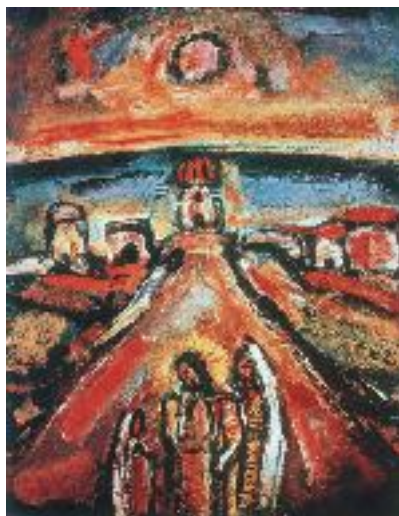
(continuare în numărul viitor)

9. Și trebuie e să mă întorc la Acel Cineva, de astă dată ca la un punct fix, reper central în deslușirea căilor de sens posibile : ei sunt aproape de Mine, vin spre Mine, vin pe calea Mea, vin pe drumul știut de ei și de Mine.