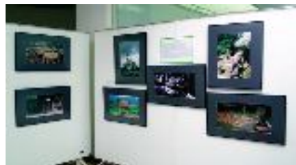
„Agroial Partener“ 2007

Muzeul Național al Agriculturii a participat cu expoziția etnografică „Ia-ți, mireasă, ziua bună” - însoțită de proiecția filmului documentar „Găteala capului la femei în Țara Oașului” , realizat de TVR 2 – și standul cu vânzare „Pentru dumneavoastră, doamnelor și domnișoarelor” .