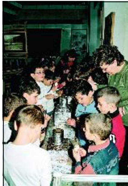
Atelier de încondeiat ouă

Muzeul Național al Agriculturii a organizat desfășurarea probei practice a Concursului Național de Fizică și Chimie pentru elevii din mediul rural „IMPULS PERPETUUM” – ediția a XV-a.