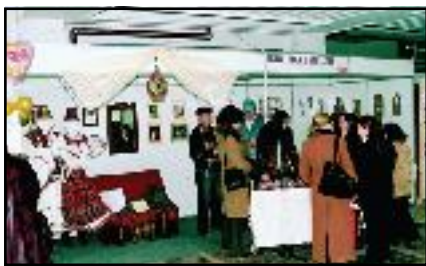
„Femina Star“ 2007