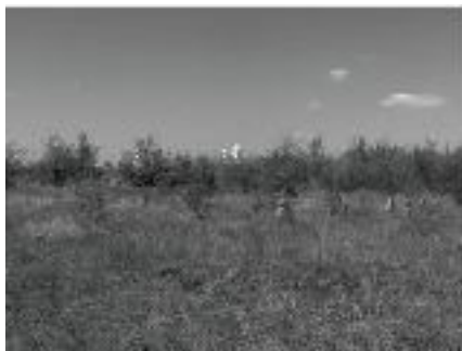
Cruci de piatră în vatra veche a satului Piteșteanu.