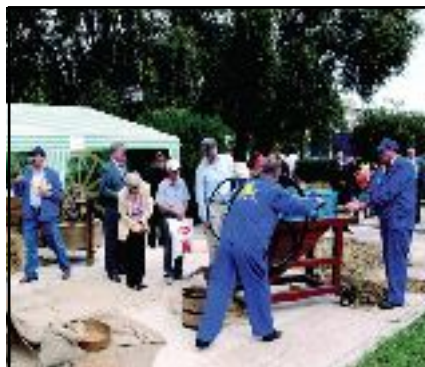
„Agroial Partener“ 2007

Târgul de Agricultură AGROIAL PARTENER 2007 – ediția a XIII-a, ZIUA OREZULUI – ediția a II-a, organizat de Camera de Comerț, Industrie și Agricultură Ialomița, Consiliul Județean Ialomița, Primăria municipiului Slobozia.