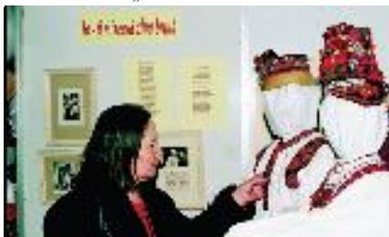
„Femina Star“ 2007