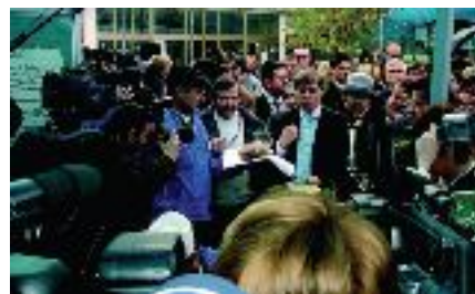
Din Cartea de impresii...

„Sunt sincer impresionat de modul în care Muzeul Național al Agriculturii din Slobozia s-a prezentat la actuala ediție a INDAGRA. Atât obiectele expuse, cât și demonstrațiile făcute cu o serie de mașini și utilaje de epocă denotă o preocupare permanentă a acestei instituții pentru conservarea tradițiilor lor, pentru valorificarea lor și mai ales pentru resuscitarea unor profesii specifice mediului rural, care se pierd în acest moment.”