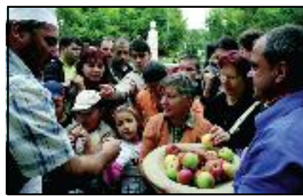
„Târgul de pâine“ 2007